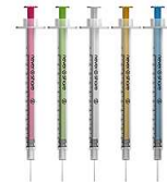
Lieblingsfarben der Nutzer